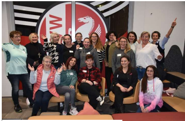
Gruppenbild TN 5. Leadership-Programm

Der Fußball- und Leichtathletik-Verband Westfalen e.V. lädt Sie ein, sich für das 6. FLW Leadership-Programm für Frauen im Sport zu bewerben. Die Module werden alle im SportCentrum Kaiserau durchgeführt.